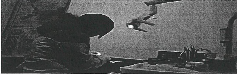
Nhân viên y tế không mặc trang phục đúng quy định khi "hành nghề"

Xã hội | Chủ nhật, 27/01/2019 14:24 (GMT+7)